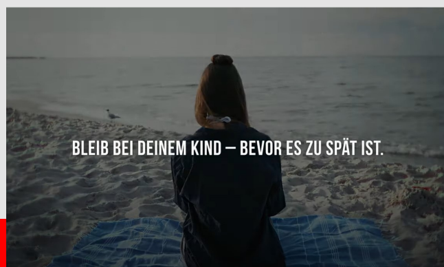
Video des Bundesverbandes