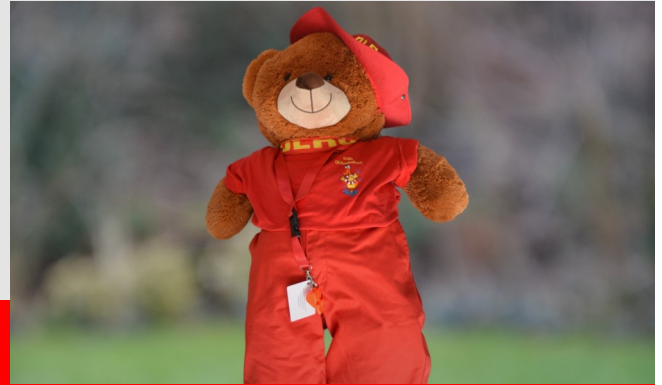
Der Rettbär freut sich auf euch

Am Samstag gab es einen weiteren Onlinespieleabend. Leider haben nur 5 Personen teilgenommen, trotzdem hatten alle viel Spaß. Wir planen für die Zukunft einen weiteren Spieleabend und hoffen auf eine größere Beteiligung. Zudem wollen wir gegen Herbst bei einer entsprechenden Corona Situation wieder mit Präsenzveranstaltungen beginnen. Falls ihr Vorschläge habt, was wir machen können oder Verbesserungsideen habt schreibt uns gerne eine E-Mail an vorstand@burscheid.dlrg-jugend.de oder sprecht uns einfach an.