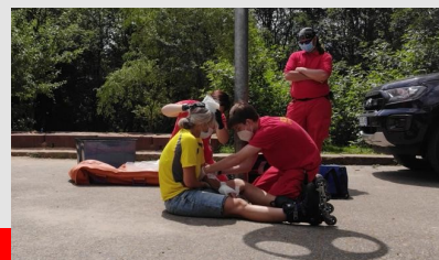
San A Prüfung

Auch im Bereich Sanitätswesen hat endlich wieder eine Präsenzveranstaltung im Bereich SAN A stattgefunden. Am letzten Wochenende fand die praktische Prüfung statt, bei der alle Teilnehmer bestanden haben.